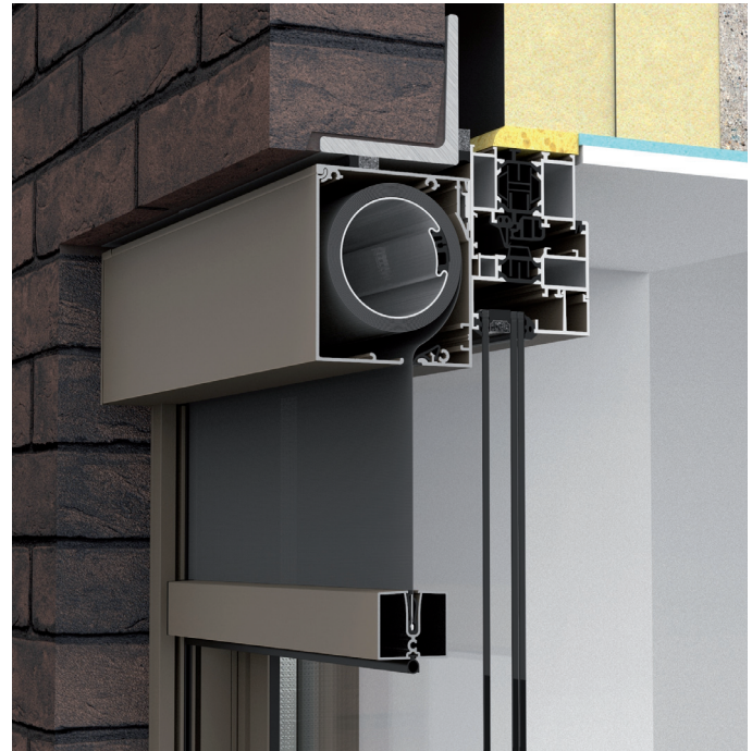
Die kompakten Maße ermöglichen es, die Screens auch noch nachträglich unauffällig in der Fassade zu integrieren.

Eine kompaktere Tuchkassette (Small: 100 x 90 mm / Medium: 120 x 110 mm) für Flächen bis 18 Quadratmeter sorgt zusammen mit einer kleineren Endschiene (35 Millimeter hoch) mit unsichtbarer Schweißnaht und Seitenführungen von knapp 20 Millimeter Breite für eine minimale Beeinträchtigung der Fassade. Dazu tragen auch die unsichtbare Befestigung der Seitenführungen sowie die farbgleiche Beschichtung der Fußplatten und der Innenführungen der Seitenführungen aus Aluminium bei.