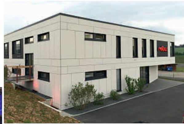
Das neue Verwaltungsgebäude.