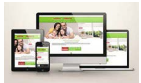
Zum Start der Messe Fensterbau Frontale 2016 bietet die Groe-Gruppe nun auch eine eigene App für alle mobilen Endgeräte an.

Groe und Roltex sind auch dieses Jahr wieder mit einem Messestand auf der fensterbau frontale 2016 in Halle 7/7-226 vertreten. Ein wesentlicher Schwerpunkt der Messe sind in diesem Jahr Lösungen für die Automatisierung von Fenstern und Fassaden. Groes Antwort darauf ist die innovative Smart Home Technologie. Dabei spielen nicht nur intelli-