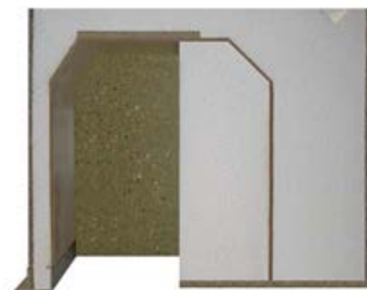
Die Jalousie- und Raffstorekästen weisen alle eine sehr stark gedämmte Innenwandung auf und besitzen im Deckenbereich eine zusätzliche Jalousie-Befestigungsplatte.

Darüber hinaus konzentriert sich das Unternehmen nicht nur auf Standardprodukte, ein besonderer Schwerpunkt wird im Hause Fasel auf Sonderlösungen gesetzt, die z.B. besonders bei der Ausführung von Spezialaufträgen gefragt sind. Trotz der vielfältigen und zeitgemäßen Lösungen für alle Mauerwerksaufbauten werden im Hause Fasel bereits weitere Innovationen geplant. Ein interessantes Marktsegment stellt der Fertighausbau dar. Industriell gefertigte Rollladenkästen sind bei der Massiv-