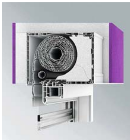
Putzträgerwinkel aus Kunststoff und Aluminium für jede Bausituation.

Mit dem Rollladenkasten-System Exte Elite XT sind bei nur einem Bausatz, einem Kopfstück, einer Dämmung und einem Befestigungsstiel vier Öffnungsvarianten möglich. Für die Renovierung und Sanierung: die klassische Lösung mit Revision nach innen. Für den Neubau: Revision nach unten, außen und Raffstore. Dadurch ergeben sich attraktive Möglichkeiten im Aufsatzkastenbereich. Die Revision außen gilt bei den Prüfinstituten zudem als luftdicht, ein weiterer Vorteil für höchste Energieeffizienz. Die Raffstore-Variante mit eigenen Führungsschienen ermöglicht die Aufnahme von Behängen aller gängigen Hersteller. Durch ein breites Programm an Putzträgerwinkeln für innen und außen lässt sich jeder Kasten individuell an die gewünschte Wandstärke anpassen. Wird anfangs kein Insektenschutz gewünscht, lässt er sich im neuen System später leicht, schnell und profitabel nachrüsten. Selbst eine Umrüstung des Antriebs gelingt dank neuer Konstruktionsdetails spielend leicht und in kürzester Zeit. Damit steht das System Exte Elite XT für maximale Flexibilität bei minimaler Teilezahl.