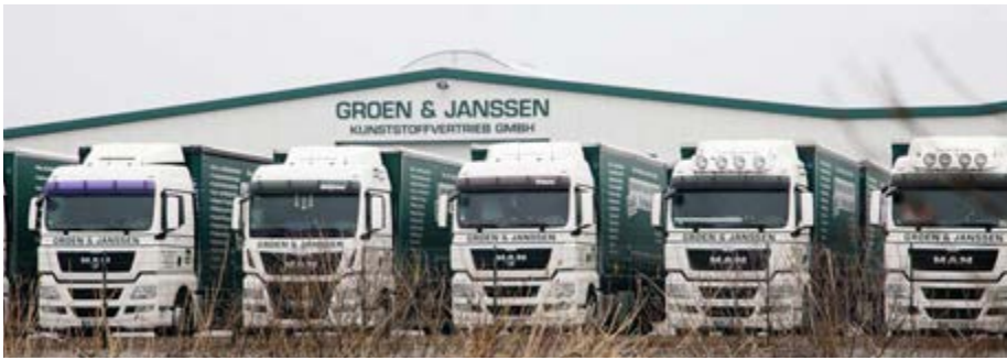
Eine eigene Auslieferflotte ermöglicht bundesweite, kurze Lieferzeiten für die Kunden.

deshalb hat sich das Unternehmen vor Jahren für Vielfältigkeit und Variabilität als Marktansatz entschieden.