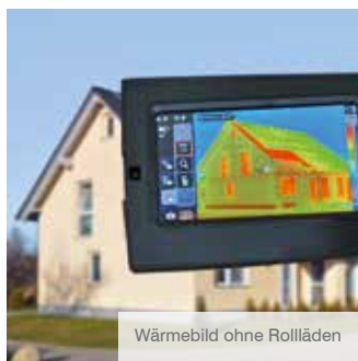
Wärmebild ohne Rollläden