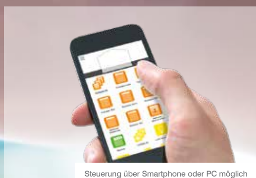
Steuerung über Smartphone oder PC möglich

Kontaktieren Sie uns, wir beraten Sie gern: