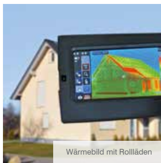
Wärmebild mit Rollläden

Kleiner Aufwand mit großer Wirkung! Die beiden Wärmebilder zeigen es ganz deutlich: Ohne Rollläden an den Fenstern Ihres Hauses tritt die kostbare Heizenergie ungehindert nach außen.