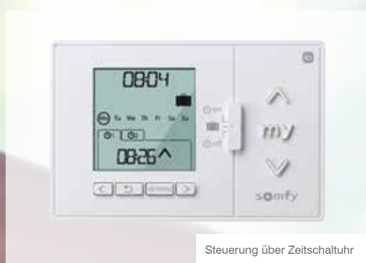
Steuerung über Zeitschaltuhr