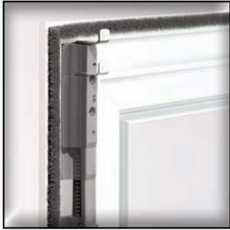
Hochwertige Befestigungsvarianten: gefederte Winkelaschen und integrierte Aushängesicherungen.