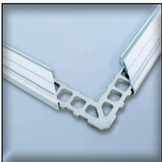
Spezielle Eckwinkel aus Aluminium sorgen für hohe Stabilität - auch bei großen Gewebeflächen.